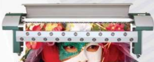
Широкоформатный сольвентный принтер Infinity разрешение до 720 dpi, ширина печати до 3,2 м