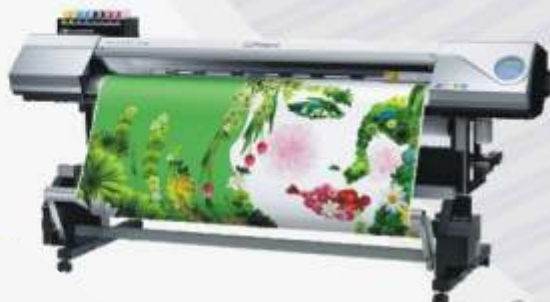
Интерьерный экосольвентный принтер Roland разрешение от 720-1440 dpi ширина печати до 1,6 м