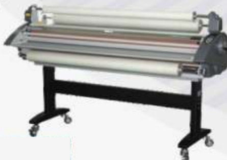
Рулонный ламинатор ширина до 1,6 м