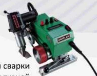
Машинка для сварки виниловых тканей